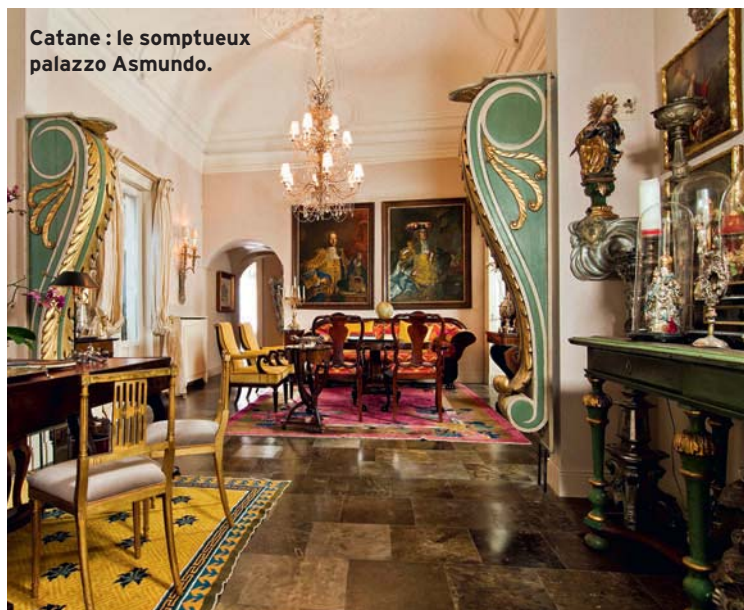
Catane : le somptueux palazzo Asmundo.