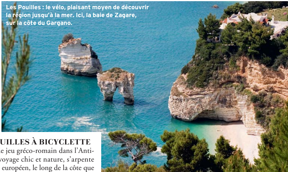
Les Pouilles : le vélo, plaisant moyen de découvrir la région jusqu'à la mer. Ici, la baie de Zagare, sur la côte du Gargano.